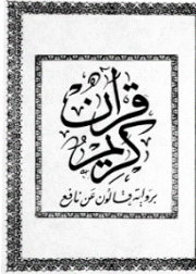
The riwaya Qâlûn from Nâfi. This mushâf is published in Tunisia by ad-Dâr at-Tunissia lilnashr. 18

ቱኒዚያ፣ በኩዋታር በከፊል አገልግሎት እየሰጠ ይገኛል፤ ይህም ቅጅ በእጅ ይገኛል፡፡