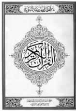
This is a well known and common mushâf of the Qur'an printed in the Saudi Arabia. They have adopted the Hafs Qirâ'a.

ይህኛው የቁርአን ቅጅ በኢራቅ በኩፋህ የአረብኛ ዝቅ የተዘጋጀ ቁርአን ነው። ኢማም አሲም አል-ኩፊ /127 ሂ የሞተ/ በሚባሉ ኢራቃዊ ሰው የተላለፈ የቁርአን ቅጅ ነው። ይህኛውም የከሊፋ ኡስማንን ተግባር ይቃረናል፤ በመጽሐፍ መልክ ያተዘጋጀው ደግሞ የእኒህ ሰው ተማሪ የሆነው የተባለ ሰው ነው። ይህ ቅጅ በሳውዲ አረብያ የሚታተመውና አብዛኛው ሙስሊም የሚጠቀምበት የቁርአን ቅጂ ነው። በእኔ ምናልባት እርስዎም ቁርአን ካለው ት በርስዎም እጅ የሚገኘው ቁርአን ማለት ነው።